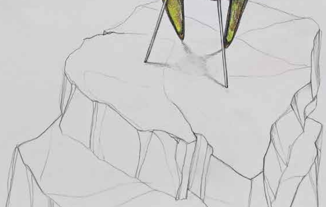
Veduta interna ed esterna dell'installazione