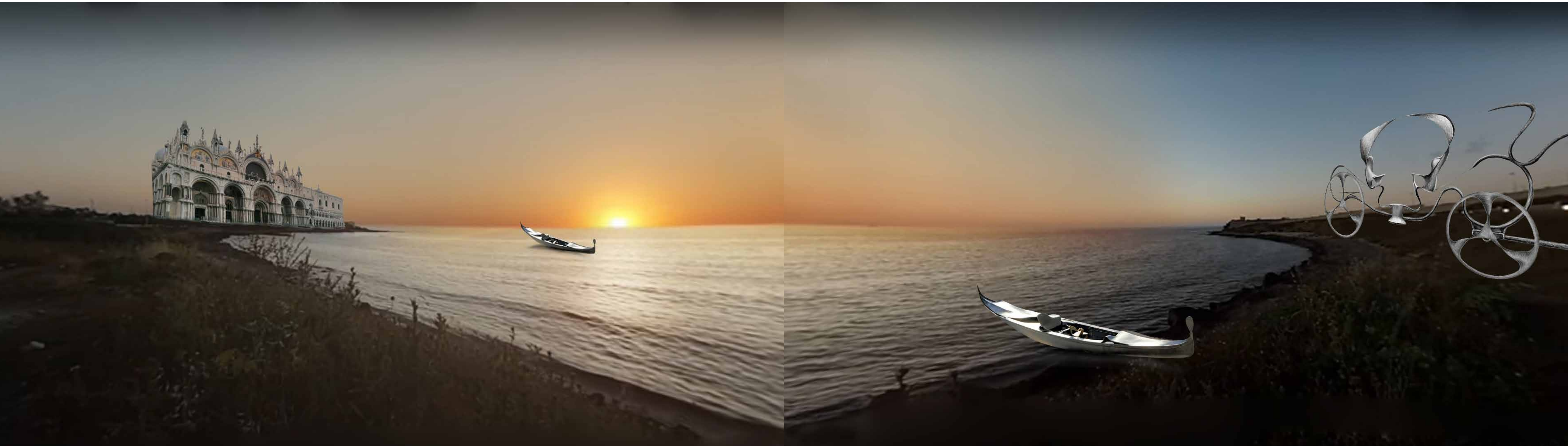
Bozzetti dei frame del video VR presente nella maschera VR